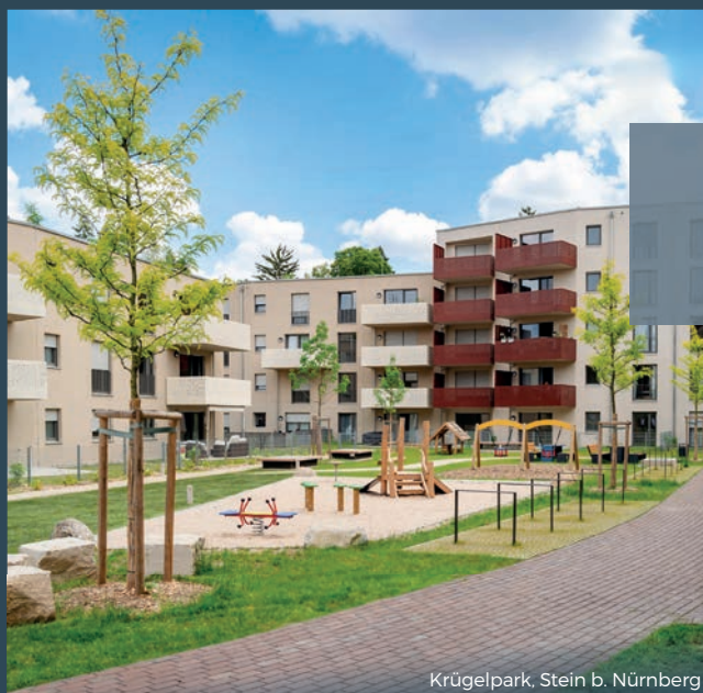
Krügelpark, Stein b. Nürnberg