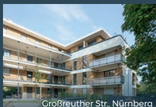
Großreuther Str., Nürnberg